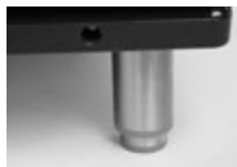
Jambes réglables (de 101-152mm) disponible avec le kit de jambe en option K-00345.