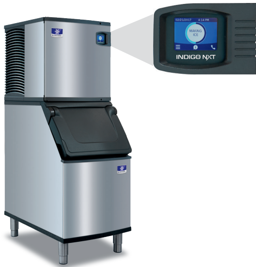
Indigo NXT série iP320 machine à glaçons sur D320 bin

Conçu pour les opérateurs qui savent que la glace est essentielle à leur entreprise, les diagnostics préventifs de la machine à glaçons de la série Indigo NXT se surveillent continuellement pour une production fiable de glace. Les améliorations en matière de nettoyabilité et de programmabilité rendent votre machine à glaçons facile à posséder et moins coûteuse à utiliser.