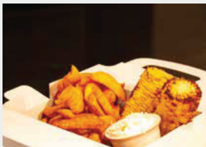
Frites (7x7) Procédé de cuisson : Air pulsé Crisp&Tasty 18 kg en 13 minutes