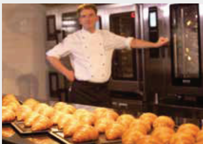
Croissants (80g) Procédé de cuisson : BakePro Automatique 80 pièces en 17 minutes