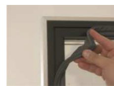
Joint magnétique amovible sans outils