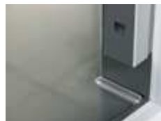
Fond intérieur en acier inoxydable avec coins arrondis estampés pour faciliter les procédures de nettoyage.